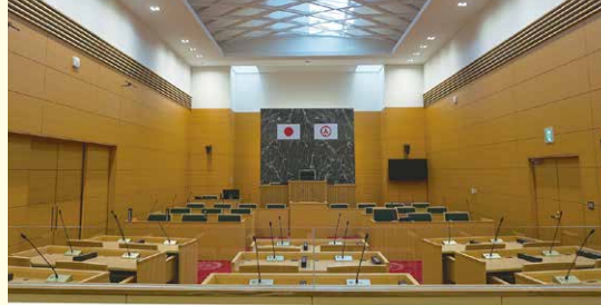
傍聴席から見た議場