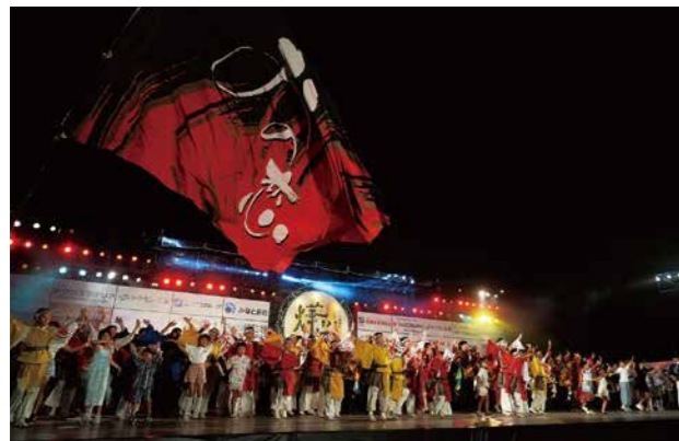
“夏のおの恋” 小野まつり・おの恋おどり