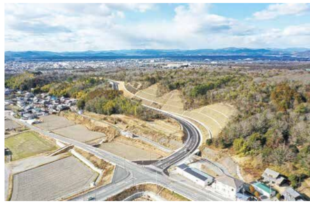
道路ネットワークの強化 新都市南北線