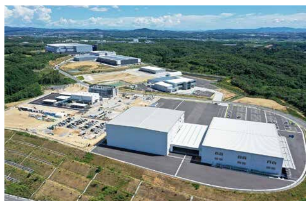
ひょうご小野産業団地 全8区画が操業開始