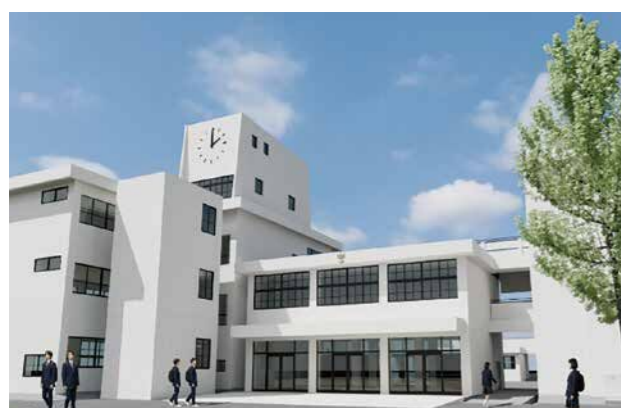
河合中学校の大規模改修