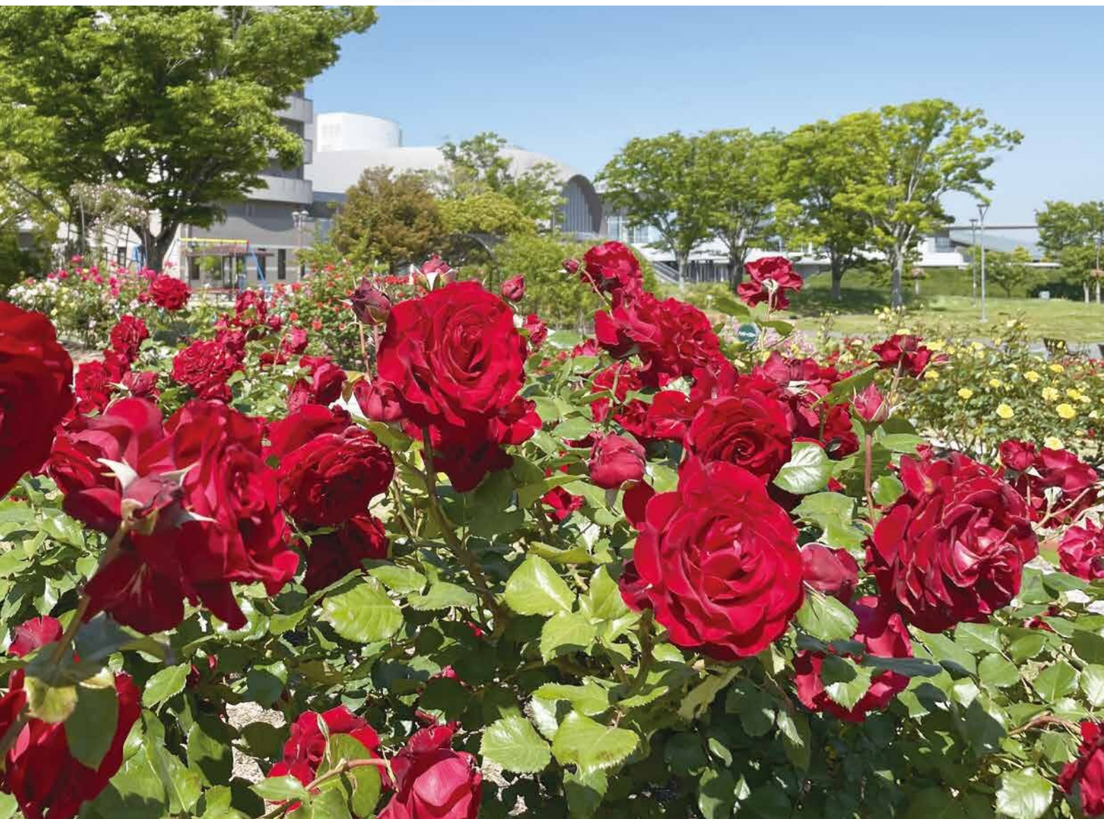
大池総合公園市民広場『ローズガーデン』