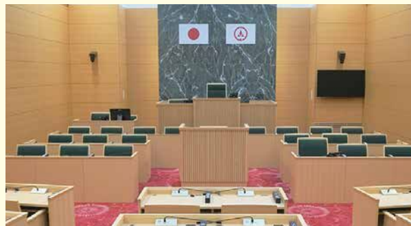
傍聴席から見た議場

小野市議会では、本会議を一般公開しています。当日、受付で住所・氏名を記入するだけで、どなたでも議会の傍聴ができます。 市役所6階 議会事務局までお越しください。