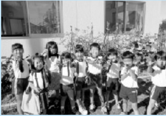
ほら夏野菜がたくさんとれたよ! (粟生保育所)