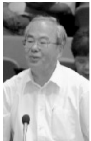
公明党 川名善三 議員

答弁 現在は市民サービス課の「市民相談窓口」で対応している。新たに設ける考えはない。労働相談は深い知識と専門性が必要になるので、労働基準監督署や、兵庫労働局を利用することをお勧めする。市は広報やホームページで相談先を紹介していく。(市当局)