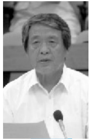
共産党 藤原 章 議員