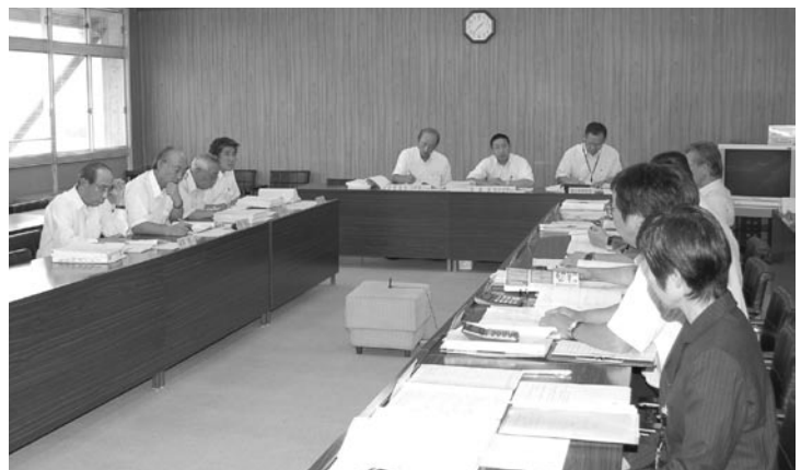
民生保健常任委員会の審査風景