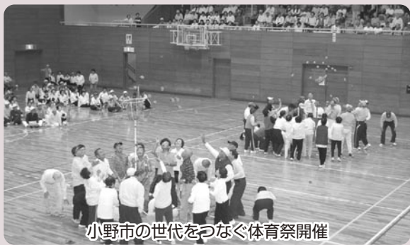
小野市の世代をつなぐ体育祭開催