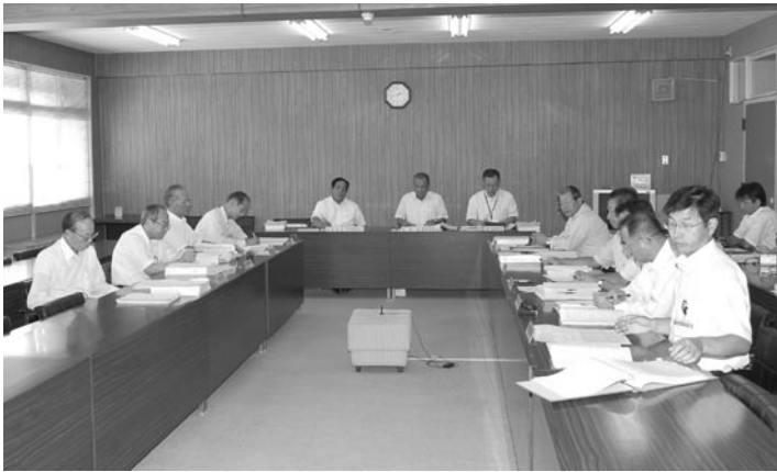
総務文教常任委員会の審査風景