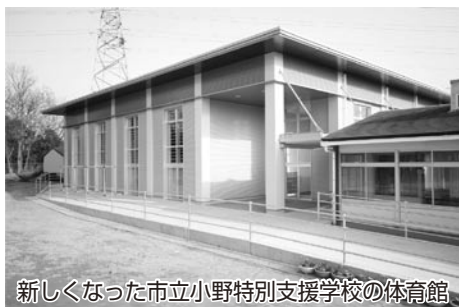
新しくなった市立小野特別支援学校の体育館