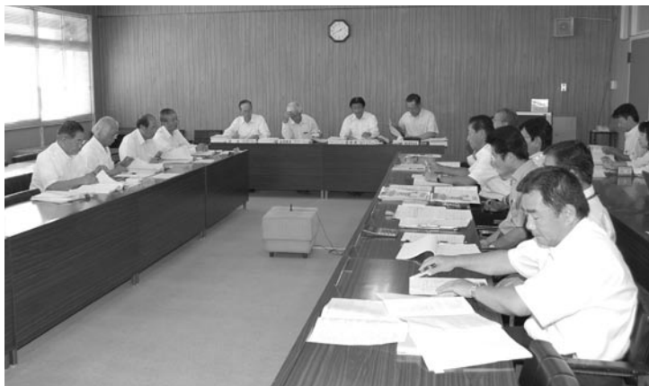
地域振興常任委員会の審査風景