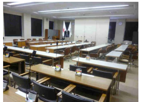
[震災により会議室を議場に使用]