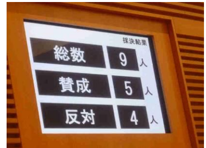
[採決結果表示 (ディスプレイ)]